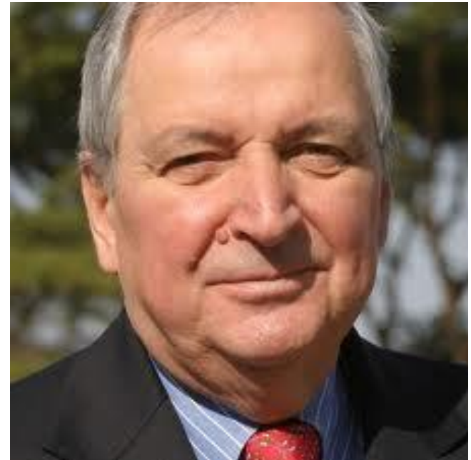
Prof. Dr. Klaus Töpfer